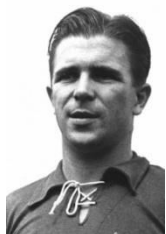
1. Puskás Ferenc

4. Az alábbiak közül ki nem játszott az Aranycsapatban?